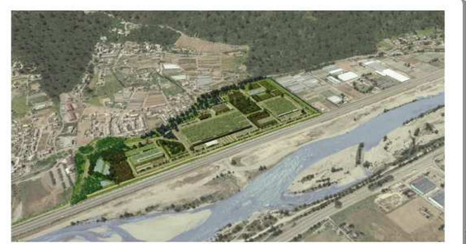
PLATEFORME AGRO-ALIMENTAIRE ET HORTICOLE DE LA BARONNE Le secteur de La Baronne est également concerné par le projet de relocalisation des activités du Marché d'Intérêt National d'Azur et la création d'un pôle d'excellence agro-alimentaire et horticole, sur un site dédié de 16 hectares, dont l'accès devra être assuré depuis le futur échangeur de La Baronne.

Le projet s'insère dans un programme de travaux réalisés de manière différée (cf. plan ci-dessous).