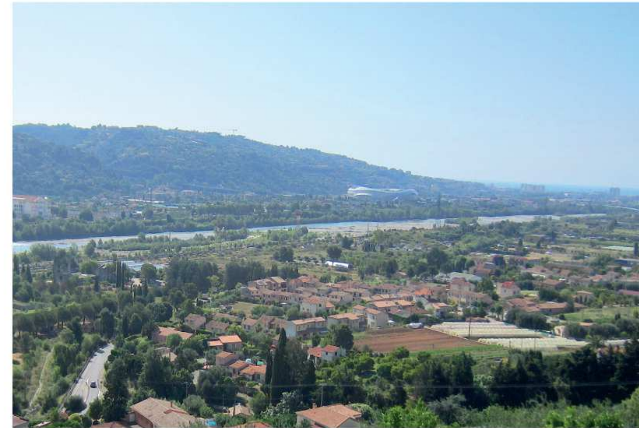
Vue du quartier de La Baronne depuis les coteaux de la rive droite du Var

En effet, les coteaux et pieds de coteaux de la basse Plaine du Var ont connu un fort développement urbain sous la forme d'habitats résidentiels et de zones d'activités. Les pointes de trafics liées aux déplacements domicile/travail des populations résidentielles croissantes et des zones économique de Saint-Laurent-du-Var, ajoutés à un réseau viaire de desserte locale de faibles caractéristiques et sans échange direct avec les voies structurantes (M6202 et M6202bis) ont rendu les conditions de circulation du secteur difficiles .