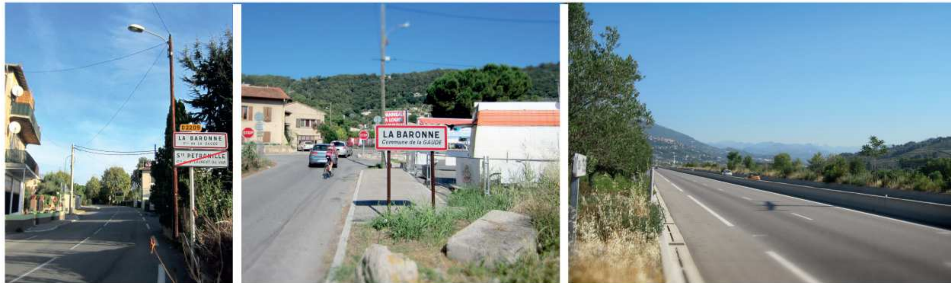
Un réseau routier de desserte locale à améliorer