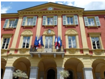
Mairie : point de RDV 9H

Il vous sera ensuite expliqué comment la Métropole Nice Côte d'Azur peut vous accompagner pour réaliser votre projet de rénovation , par le biais de son programme « Rénovons ensemble votre logement » (accompagnement financier, technique et administratif gratuit).